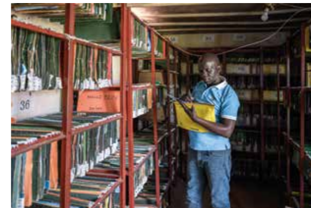
Uganda, St. John XXIII Hospital Aber

L'intervento ha inoltre avviato la digitalizzazione dei dati, ancora prevalentemente raccolti in forma cartacea, attraverso la fornitura di attrezzature informatiche. Questo passo ha permesso alle strutture di gestire le informazioni in modo più organizzato e tempestivo, migliorando la capacità di prendere decisioni basate su dati concreti.