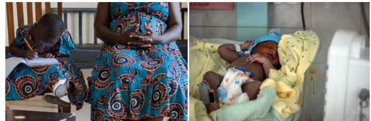
Kenya, Malindi Sub-County Hospital