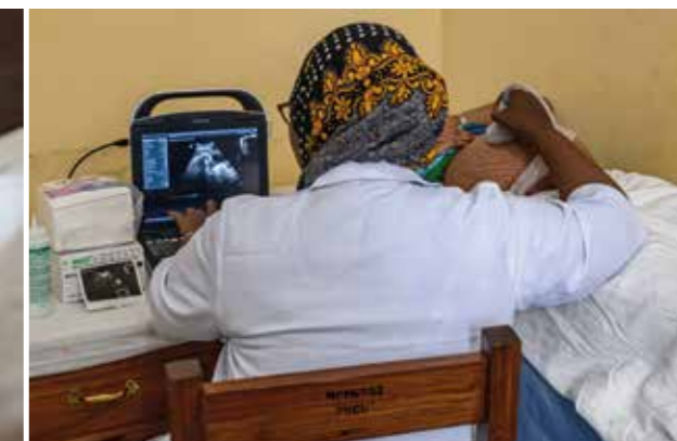
Tanzania, Mbedae Health Center