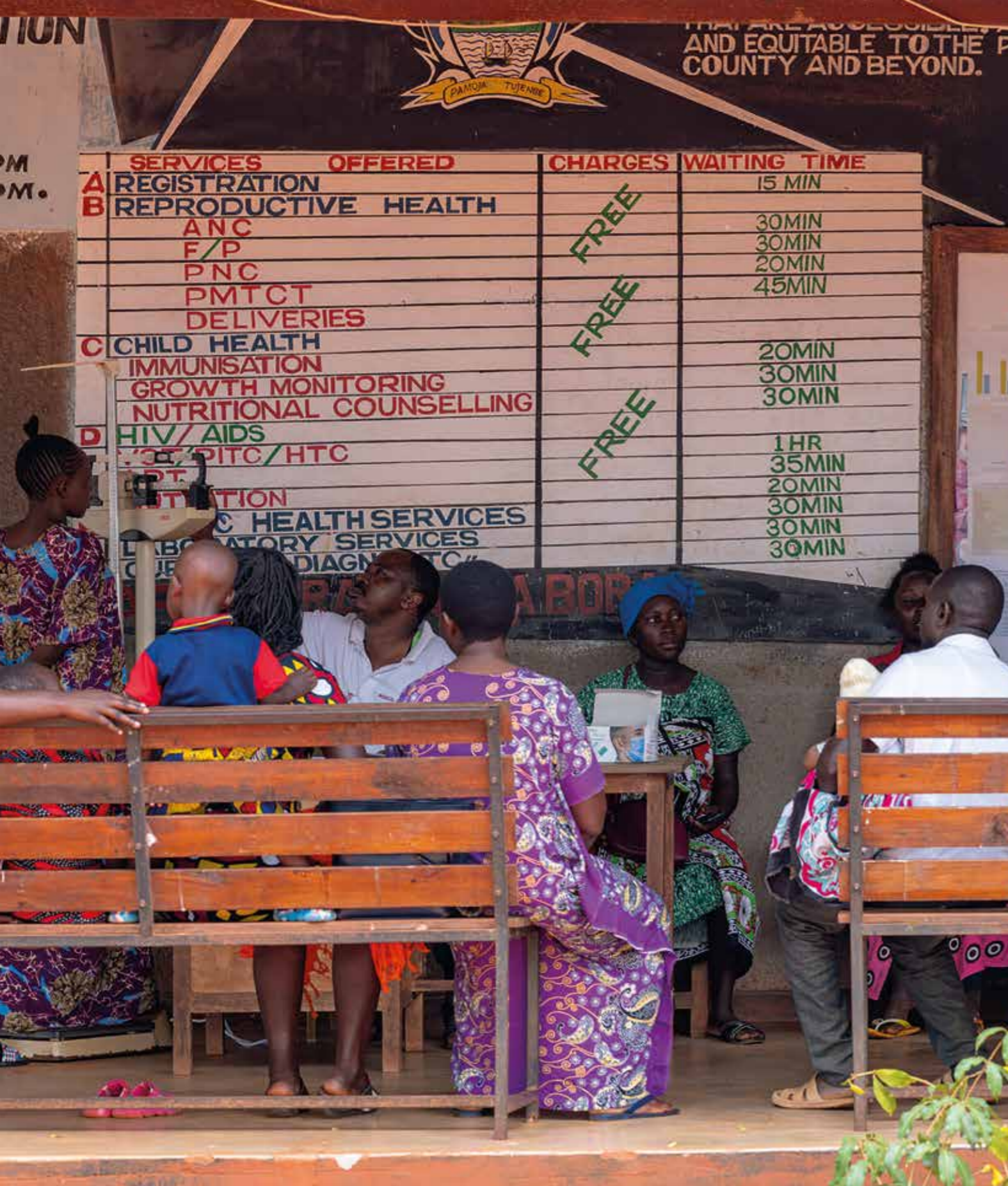
Kenya, Baolala Health Center