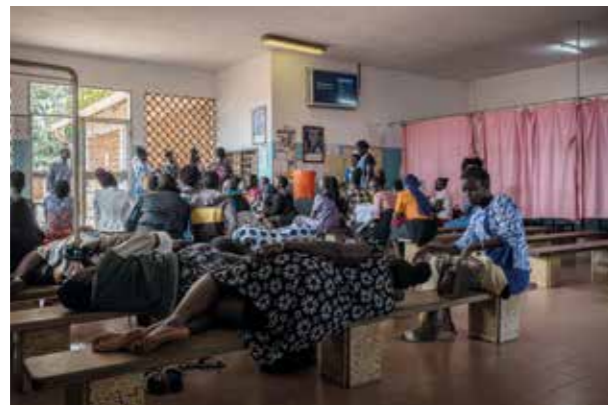
Uganda, St. Mary's Lacor Hospital