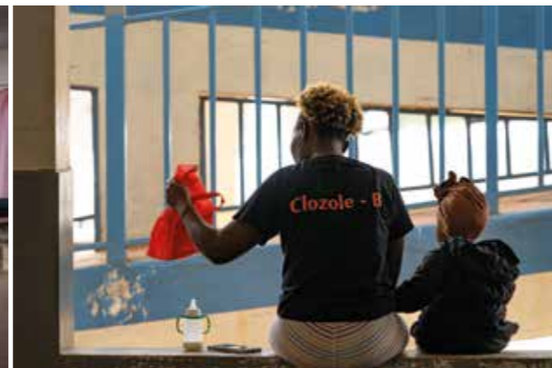
Kenya, Babadogo Health Center