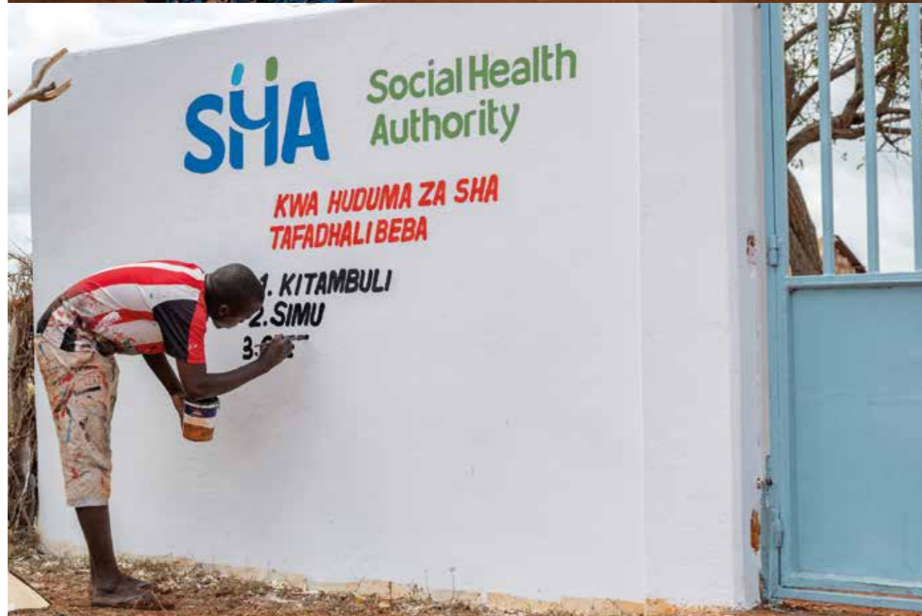
Kenya, Baolala Health Center

I risultati raggiunti, mostrano come il programma abbia contribuito in modo significativo al miglioramento dei servizi di salute materna e infantile nelle aree di intervento, registrando progressi misurabili negli indicatori chiave di mortalità materna, perinatale e neonatale.