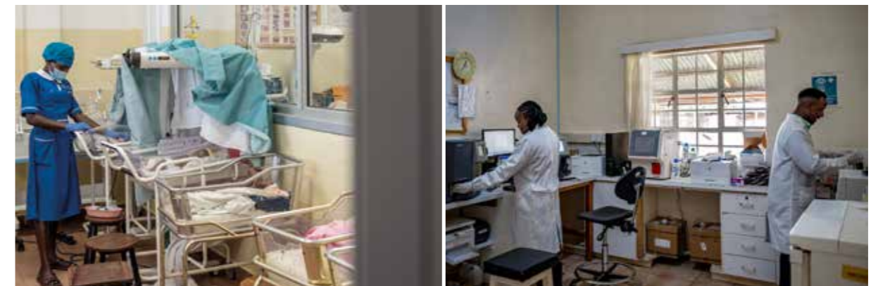
Uganda, St. Mary's Lacor Hospital

Questo ha permesso, insieme alle attività di formazione, di migliorare la gestione delle emergenze ostetriche e la qualità delle cure prenatali, garantendo un'assistenza più sicura ed efficace.