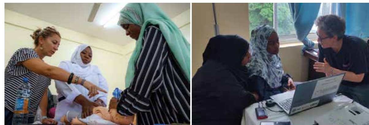
Tanzania, Kivunge Regional Hospital (tutte le foto in questa pagina)