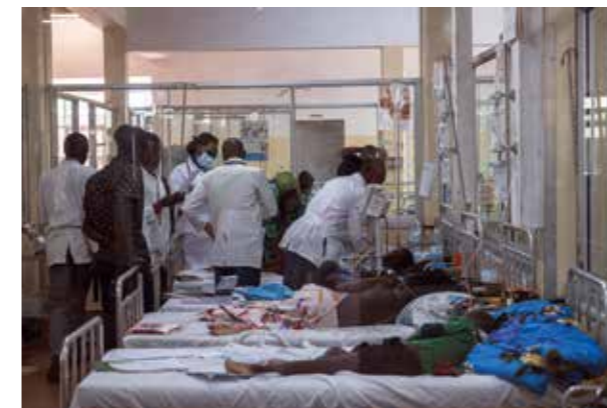
Uganda, St. Mary's Lacor Hospital

Un ruolo chiave è stato svolto dalla rete degli operatori del sistema sanitario della Toscana, che, in stretta collaborazione con il personale locale, ha facilitato le giornate di formazione.