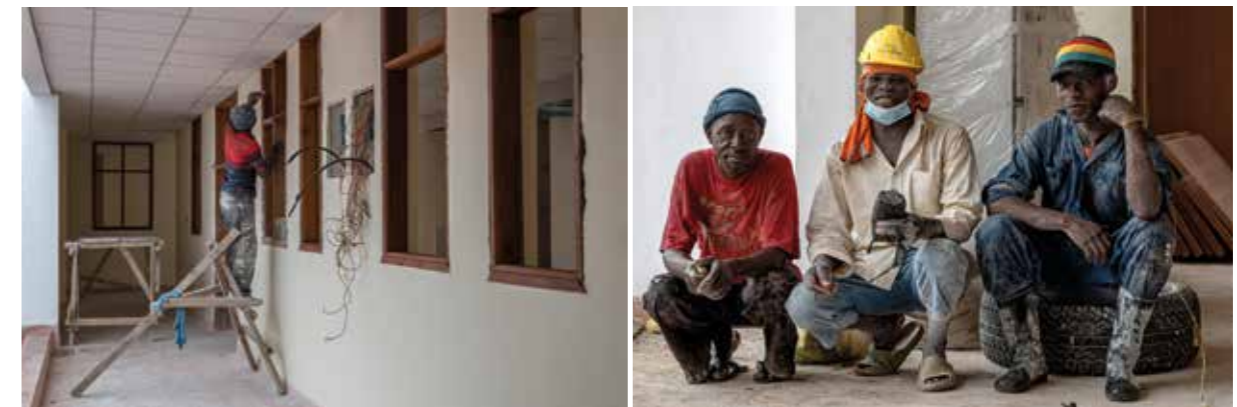
Kenya, Malindi Sub-County Hospital (tutte le foto in questa pagina)

Il Malindi Sub-County Hospital è una struttura di riferimento per l'assistenza sanitaria avanzata di un bacino di circa 70.000 persone e registra ogni anno circa 5.000 parti, di cui il 14% presenta complicanze legate al travaglio e al parto. In precedenza, l'ospedale disponeva di una sola sala operatoria condivisa per tutte le attività chirurgiche, sia programmate sia in emergenza. La realizzazione del nuovo blocco parto quindi permetterà di ridurre i tempi di intervento e di garantire una risposta più rapida ed efficace alle emergenze ostetriche.