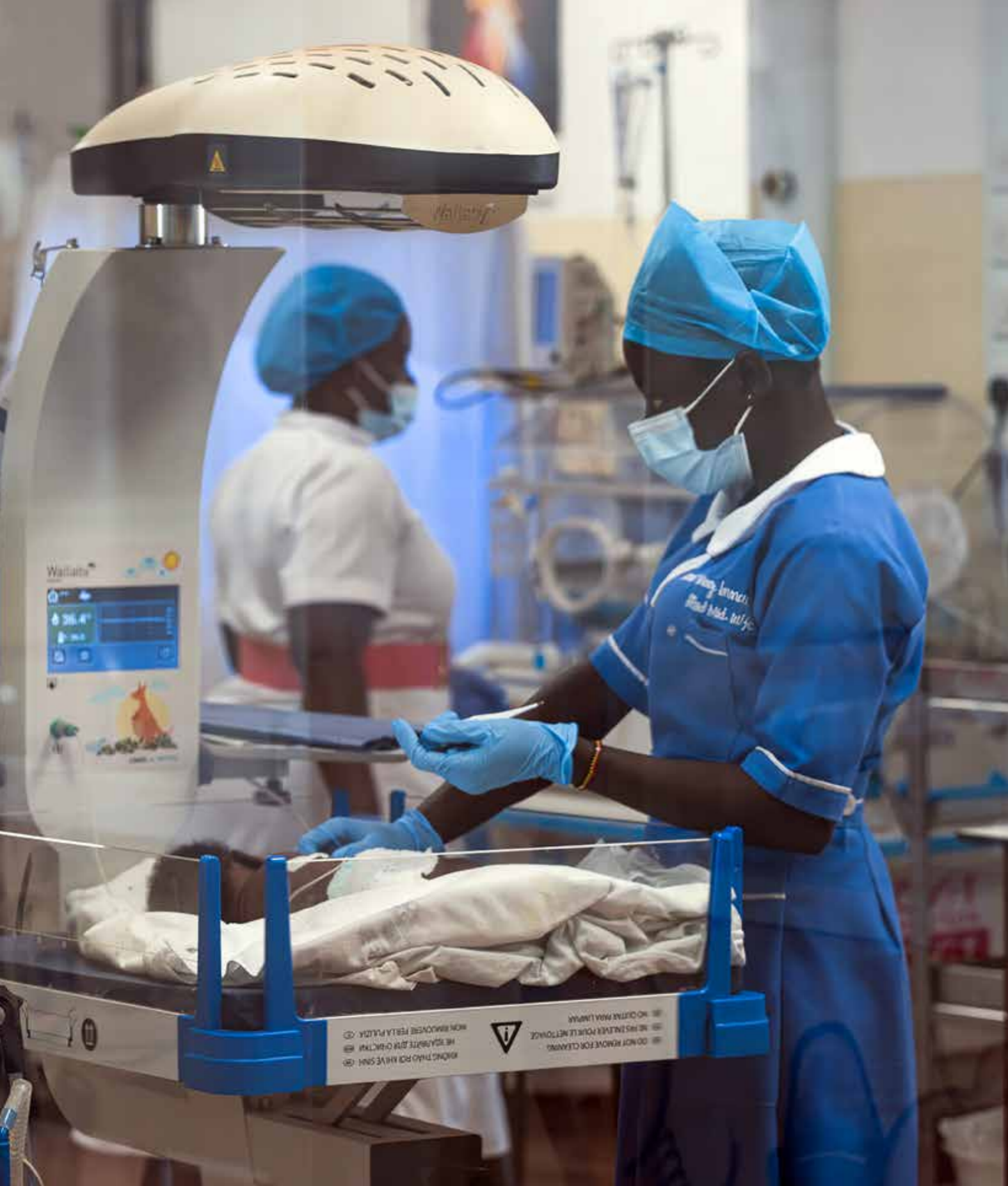
Uganda, St. Mary's Lacor Hospital