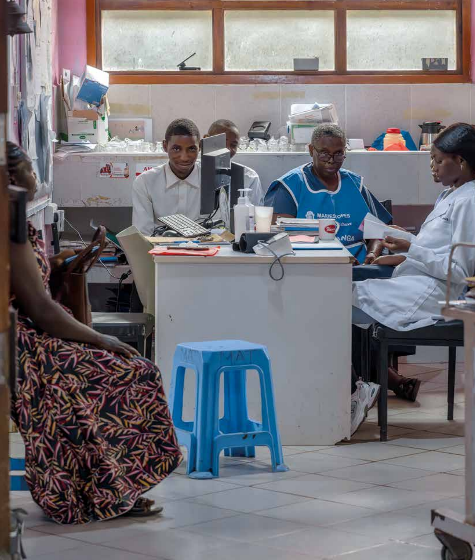
Kenya, Malindi Sub-County Hospital