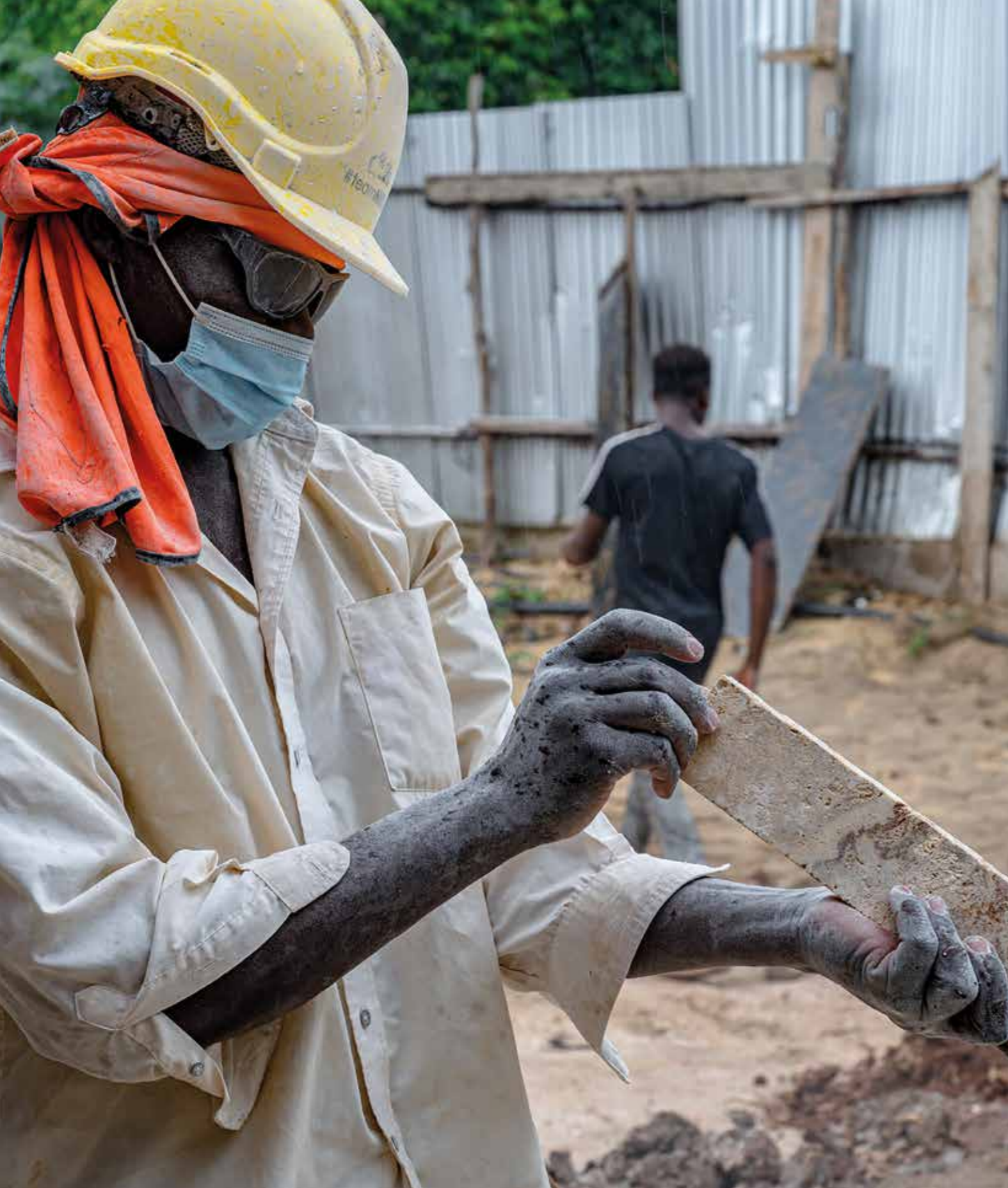
Kenya, Malindi Sub-County Hospital