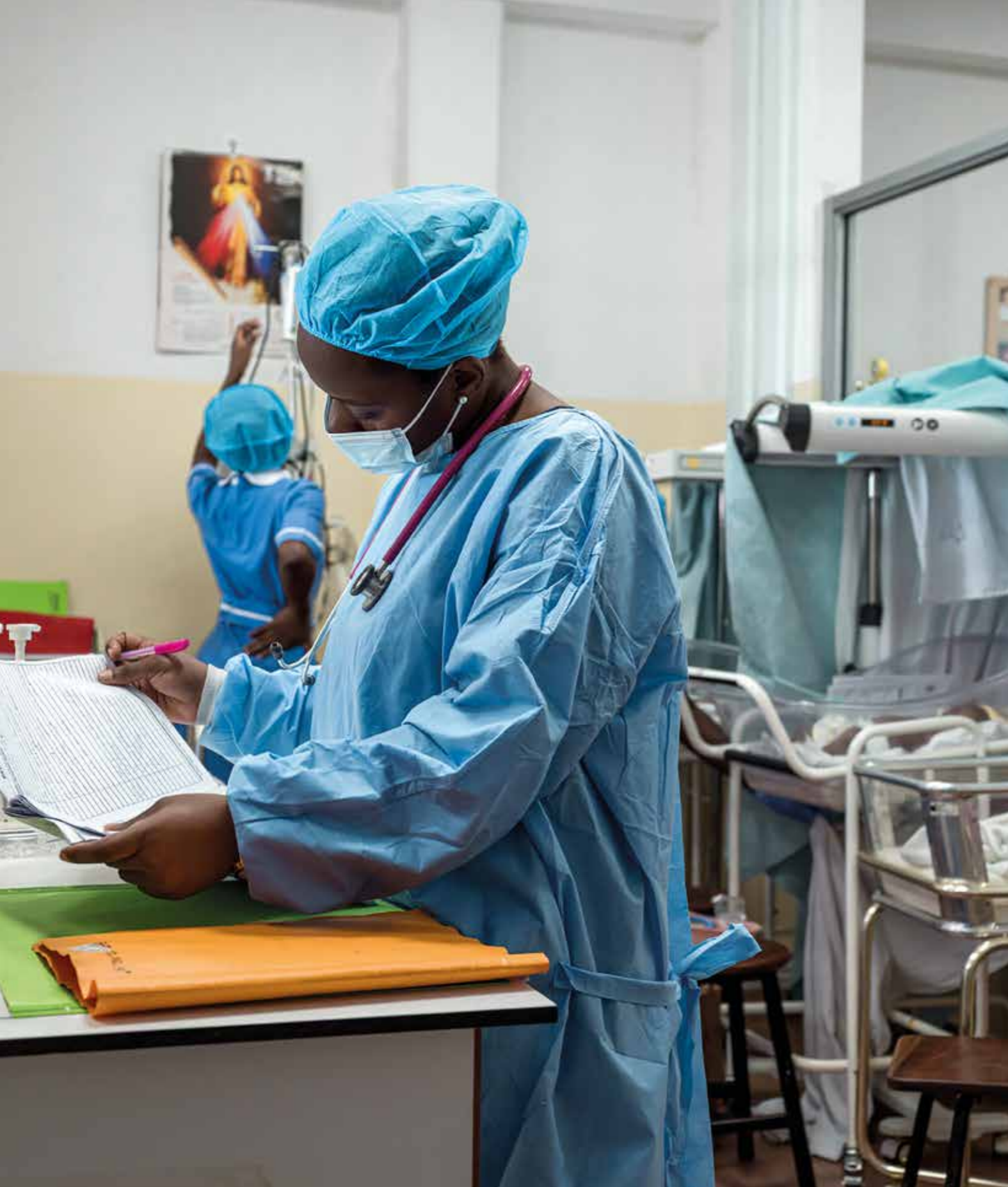
Uganda, St. Mary's Lacor Hospital