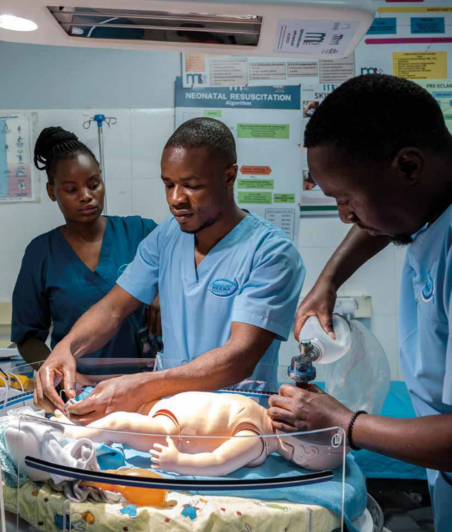
Kenya, Ruaraka Uhai Neema Simulation Center