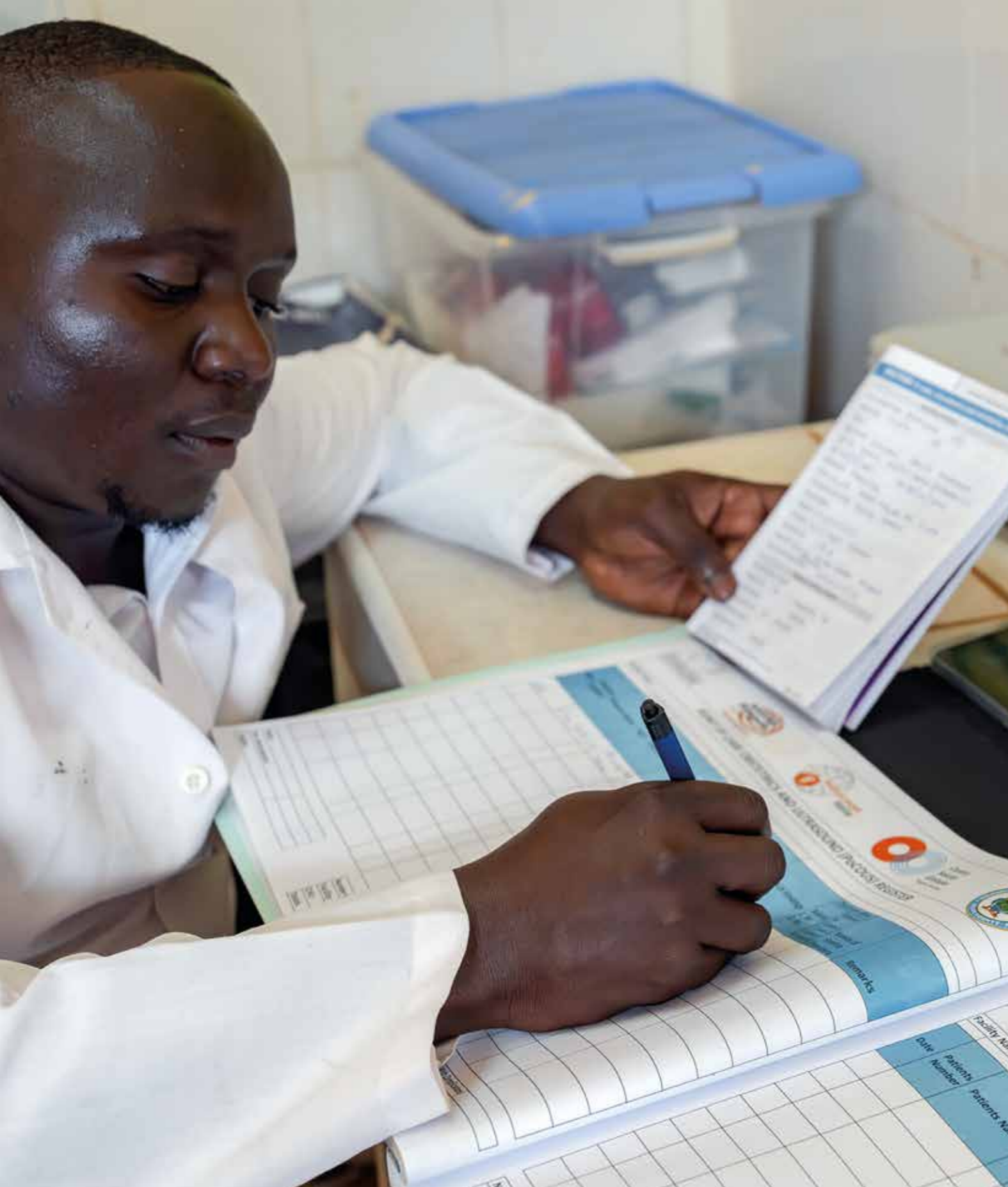
Kenya, Baolala Health Center