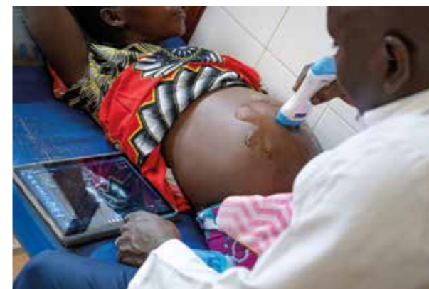
Kenya, Baolala Health Center

Nelle zone rurali dei tre Paesi coinvolti, l'accesso alle cure prenatali è spesso limitato e le ecografie sono rare o disponibili solo nelle fasi avanzate della gravidanza. L'elevato costo delle apparecchiature, la carenza di personale specializzato, la distanza dalle strutture di riferimento e la scarsa informazione sulla salute riproduttiva rappresentano ancora oggi importanti barriere all'accesso a questo servizio. Il progetto POCOUS contribuisce a superare questi ostacoli, avvicinando cure essenziali alle donne che ne hanno più bisogno.