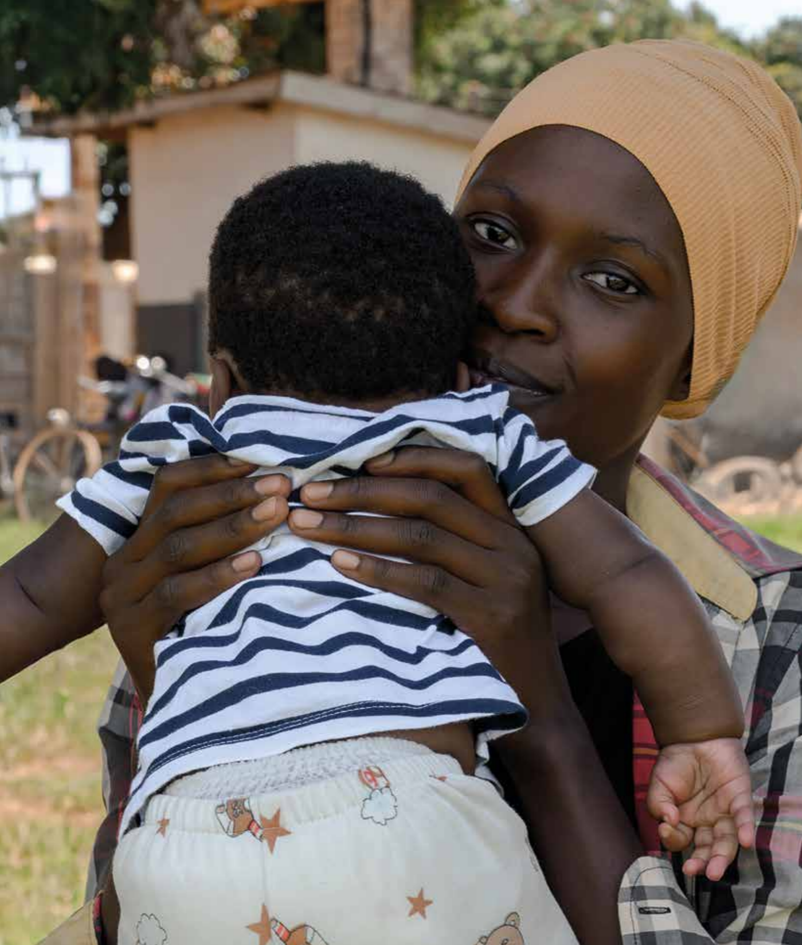
Uganda, St. John XXIII Hospital Aber